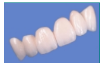
Frontbrug met tandkleurige keramiek bekleed